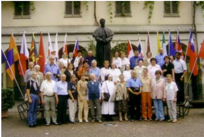
Beim Hl. Don Bosco