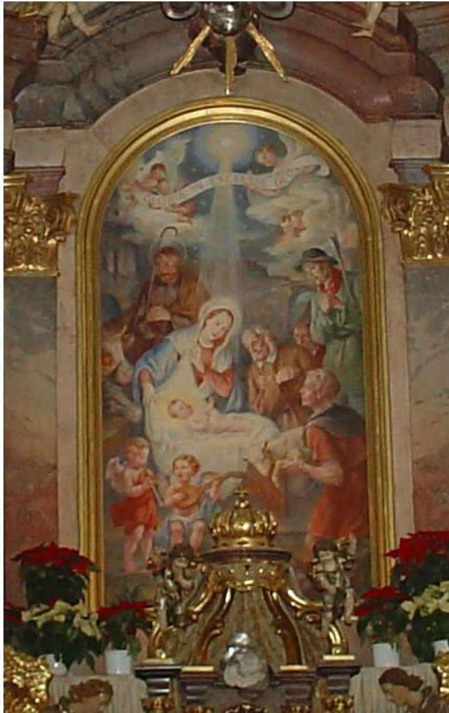
Das Weihnachtsbild im Hochaltar von St. Justina